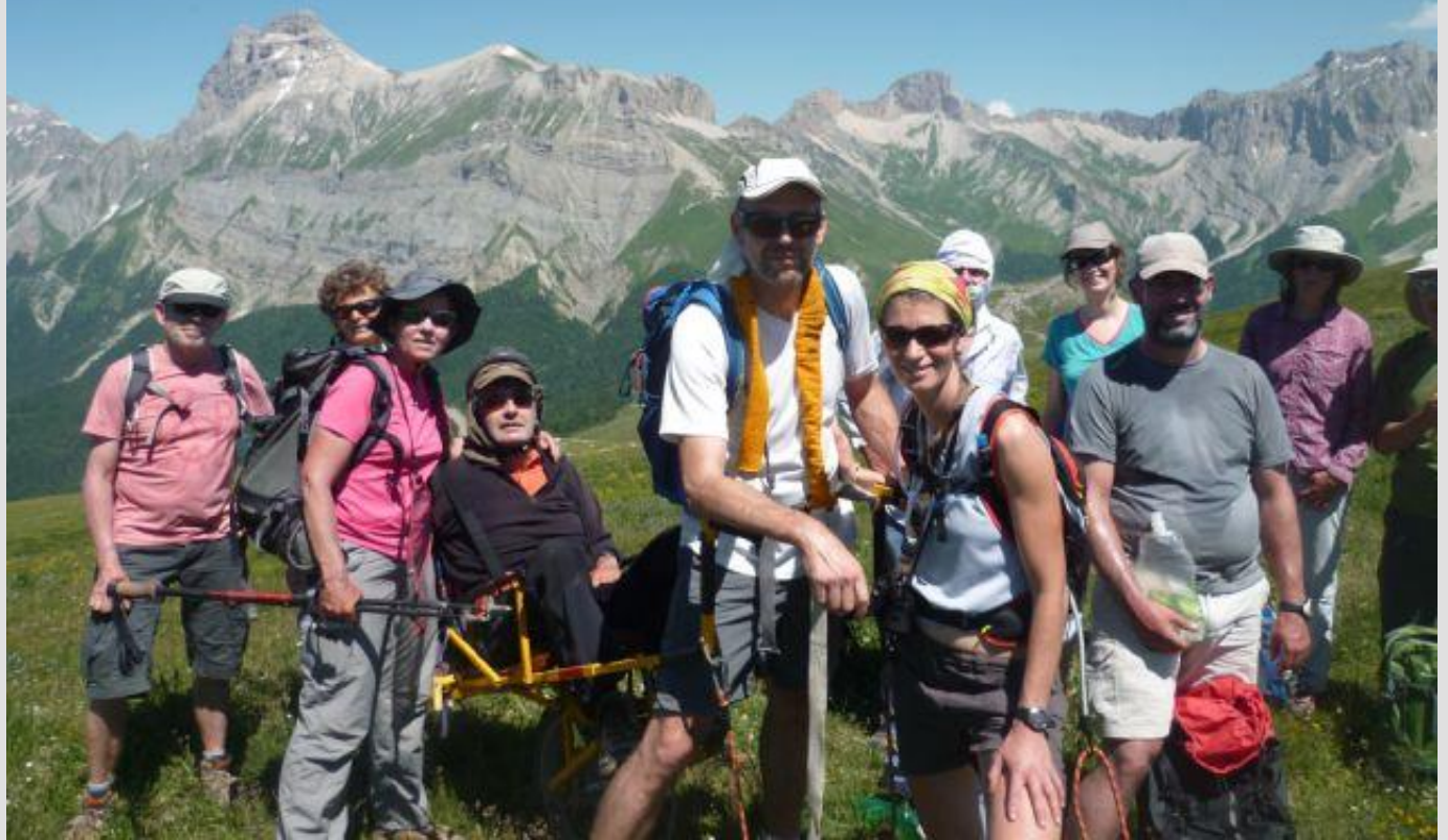
L'équipe du deuxième jour (un moustachu à cagoule se cache sur cette photo).