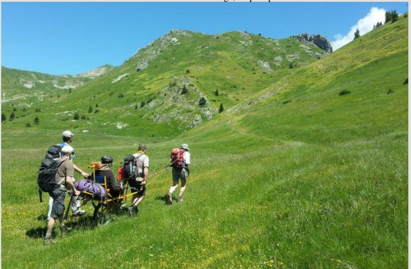
C'est bucolique et bien vert