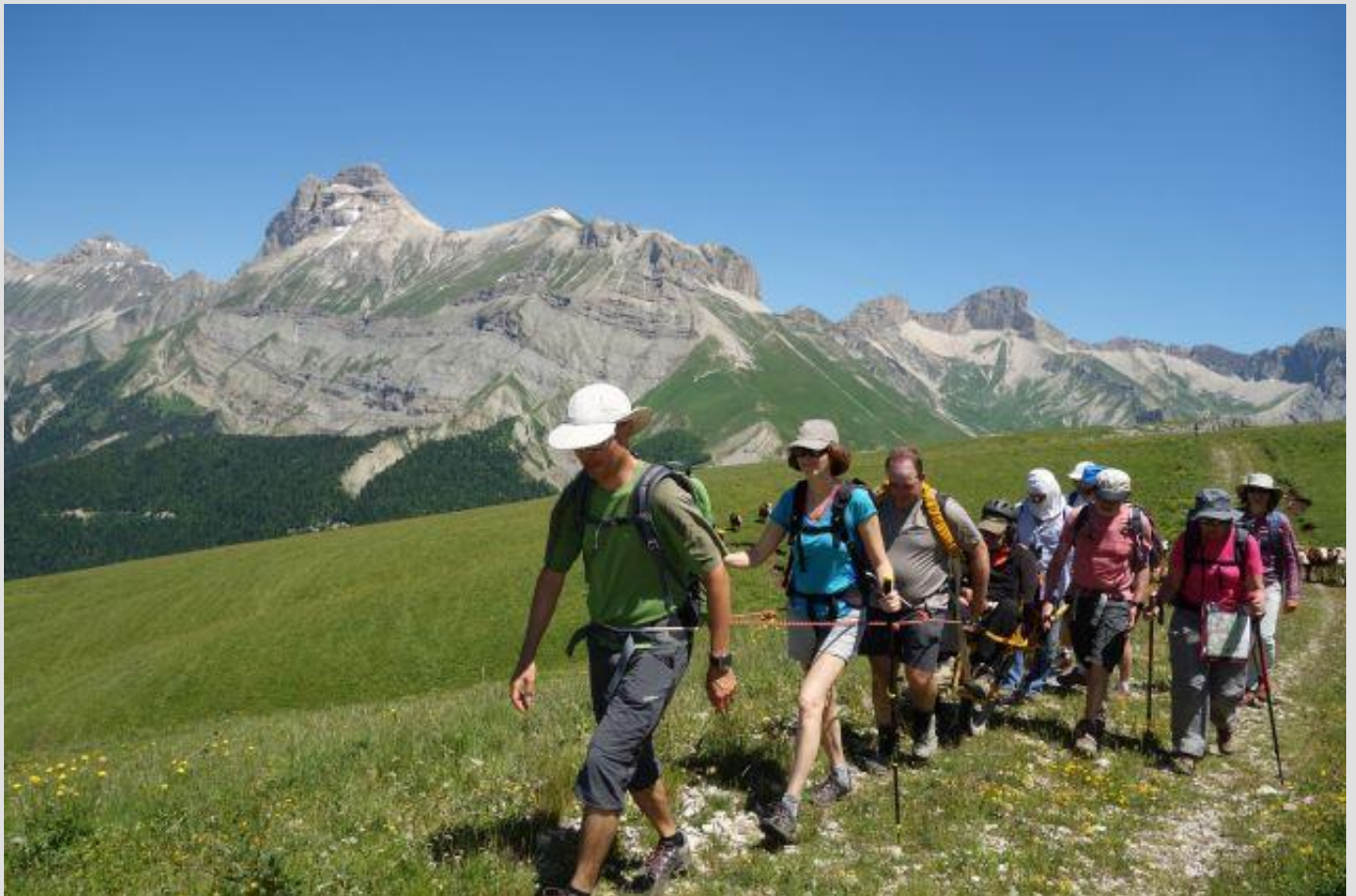
Sur la crête de la Pointe Feuillette, face au Grand Ferrand