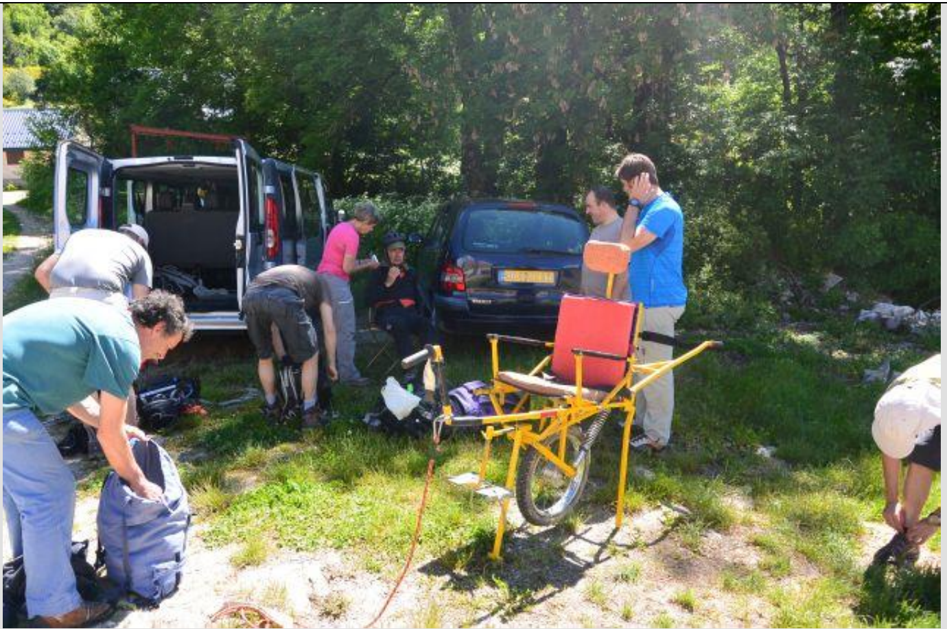
On a réussi le test du montage, on peut partir.