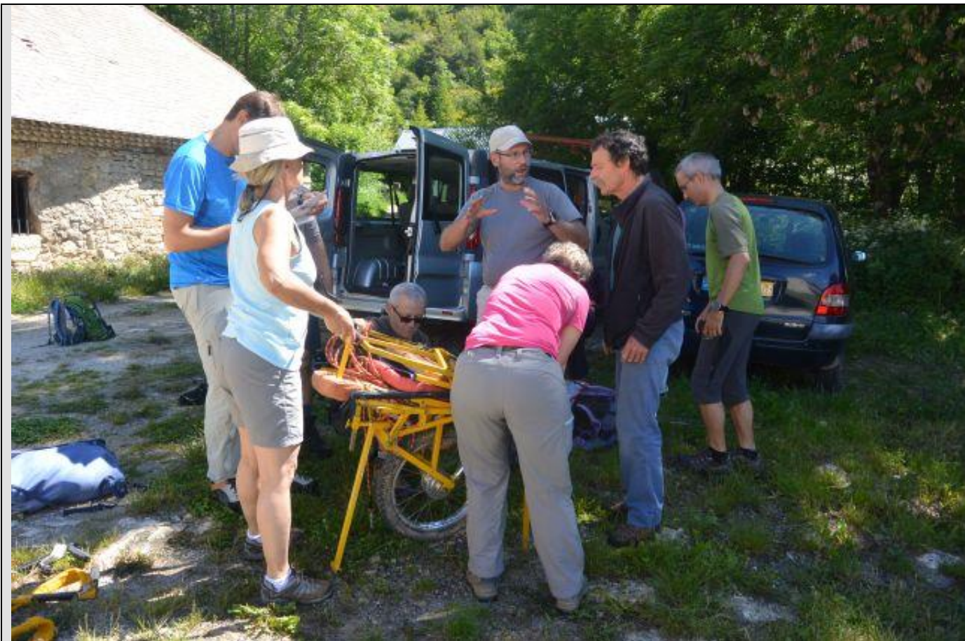
Montage de la Joëlette (expertise en mécano très appréciée)