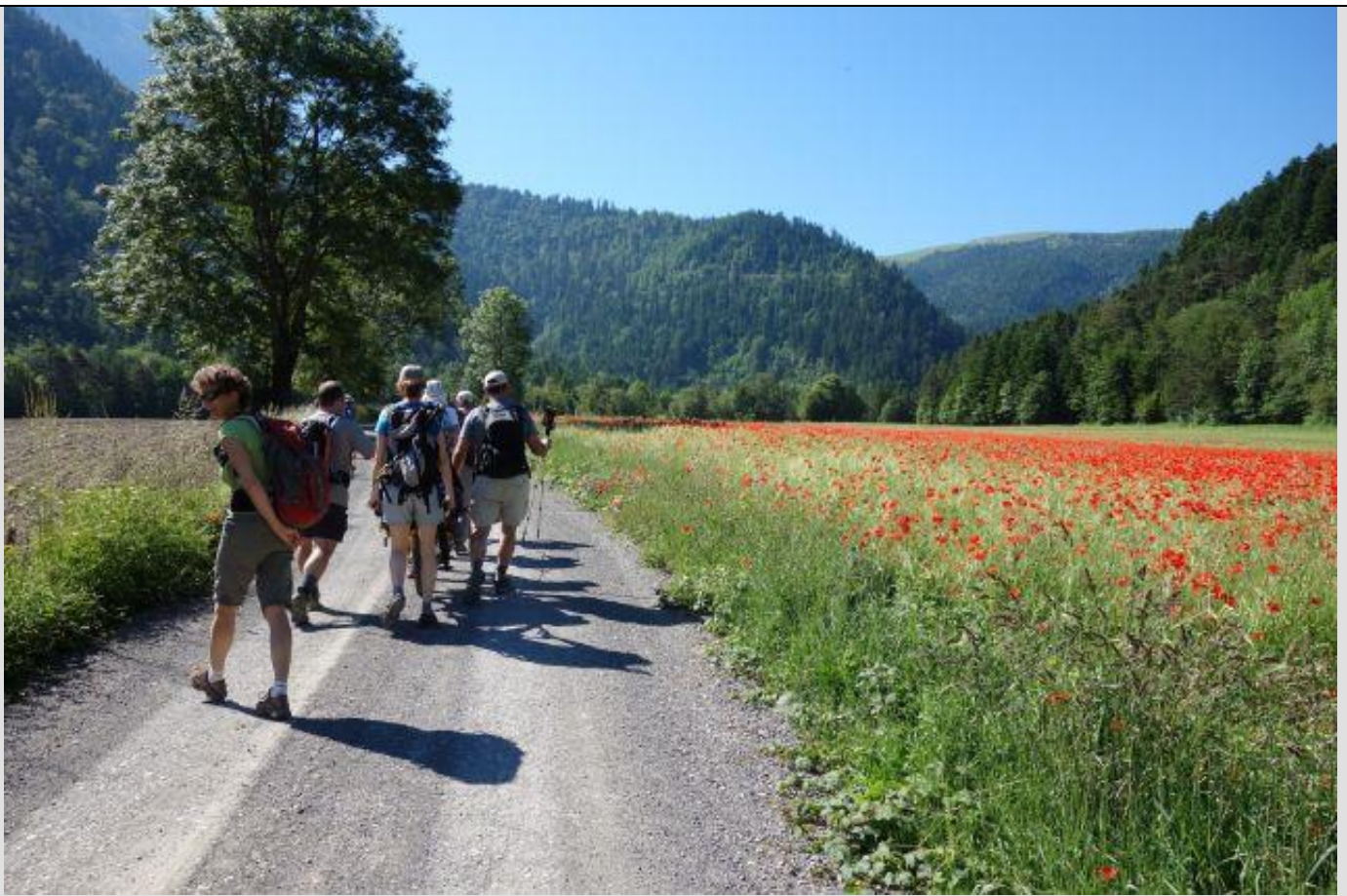
Un champ de blé-coquelicots au départ de Tréminis.