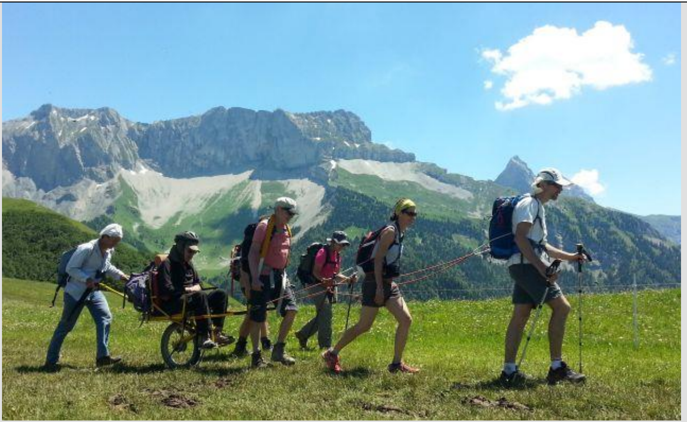
Devant les Aiguilles de la Jarjatte