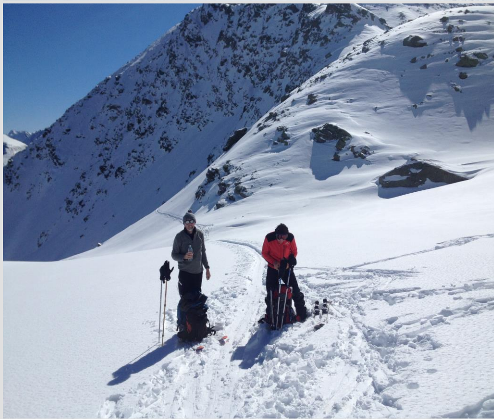
montée au Rothorn,

LOCATION DE MATERIEL DE LA SECTION: - Nombre et Type de Cordes Sections - PROBLEMES (sur le matériel de la section ...): - REMARQUES DIVERSES: -