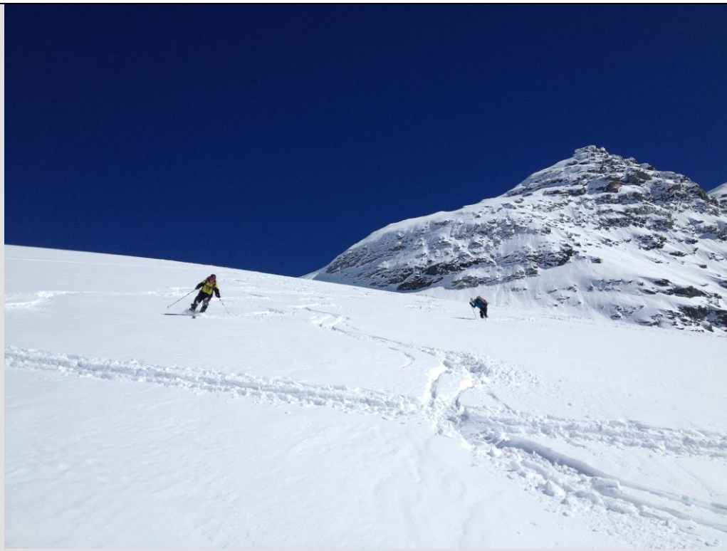
descente du Breithorn