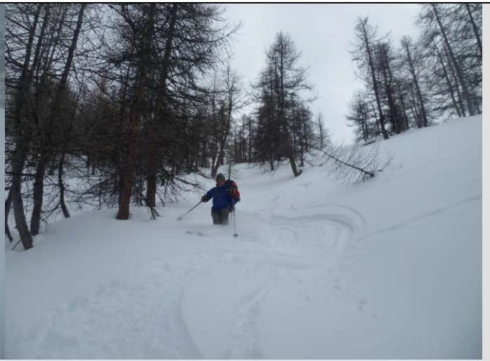
On se venge vers Mirandol