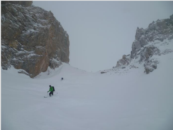
Grand beau tout poudre à la Portiolette