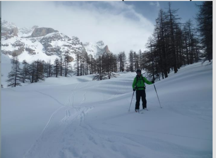
Descente sur Fouillouse