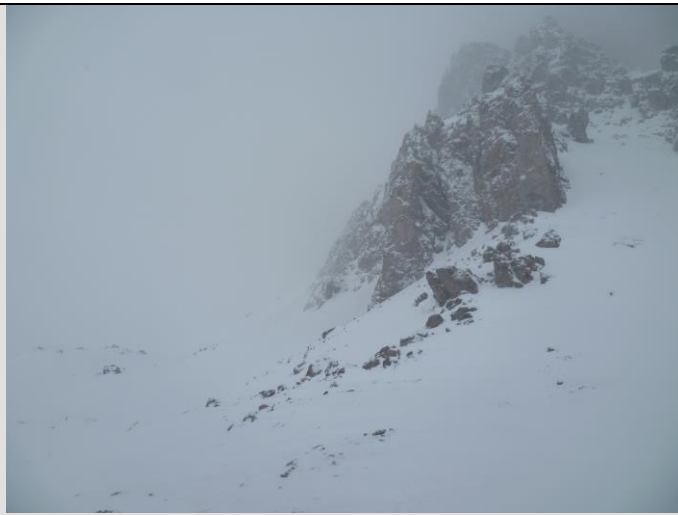
Grand soleil (définition de météo France)