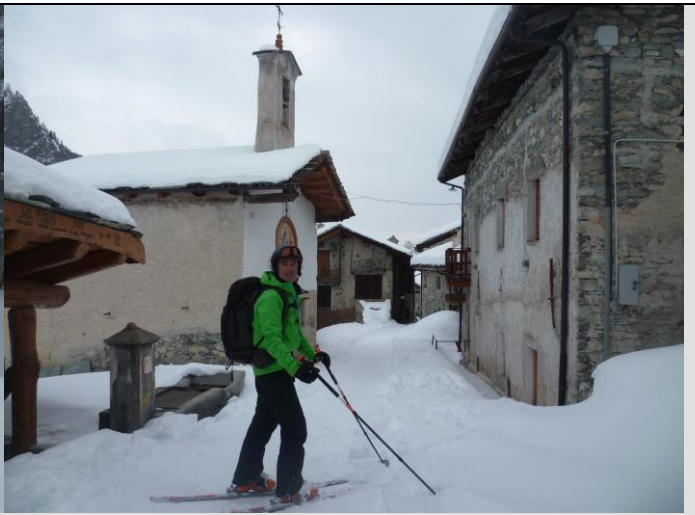
Traversée du village de Pontebardo