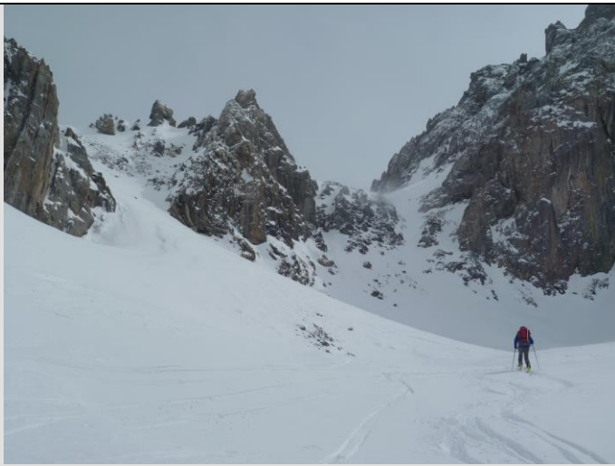
Michel trace vers le Col d'Enchiausa (à gauche)