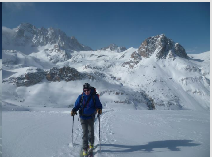
En montant vers la Pointe Haute de Mary