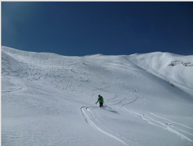
Col de Rouanette

http://www.camptocamp.org/outings/732615/fr/pas-de-la-couletta-et-col-de-mirandol-depuis-fouillouse