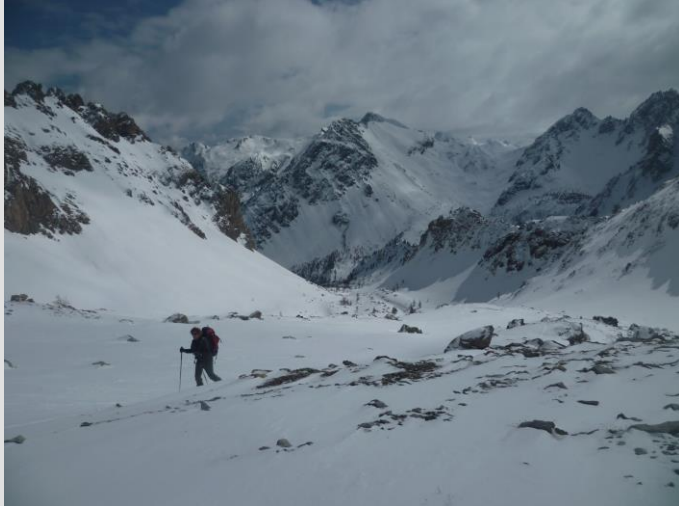
Remontée du vallon della Scaletta